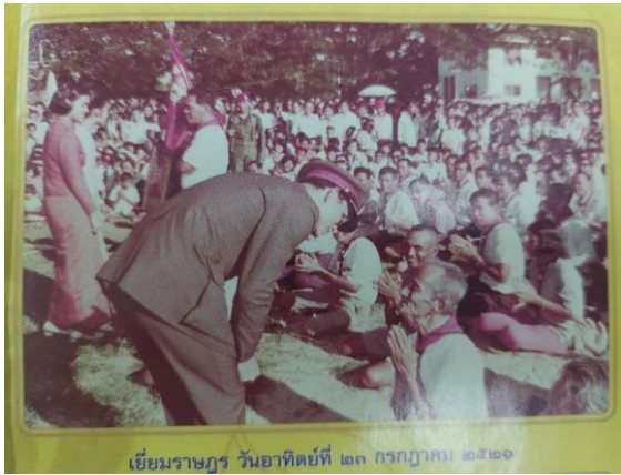
เยี่ยมราษฎร วันอาทิตย์ที่ ๒๓ กรกฎาคม ๒๕๒๑