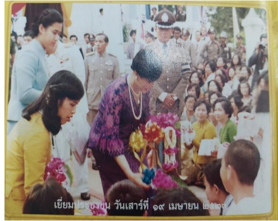
เยี่ยมประชาชน วันเสาร์ที่ ๑๙ เมษายน ๒๕๒๑