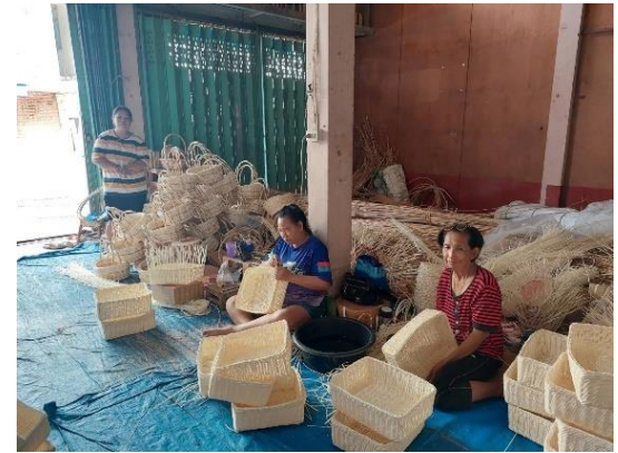
๕.๒ ร้านจำหน่ายผลิตภัณฑ์เครื่องหวาย...อยู่ที่ถนนสายอ่างทองแสวงหา ตรงข้ามโรงเรียนโพธิ์ทอง “จินตามณี” ต.อ่างแก้ว อ.โพธิ์ทอง จ.อ่างทอง