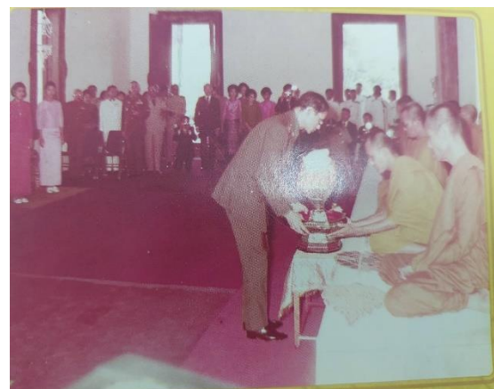
พิธีพินาศสตร์ วันเสาร์ที่ ๑๙ เมษายน ๒๕๒๓