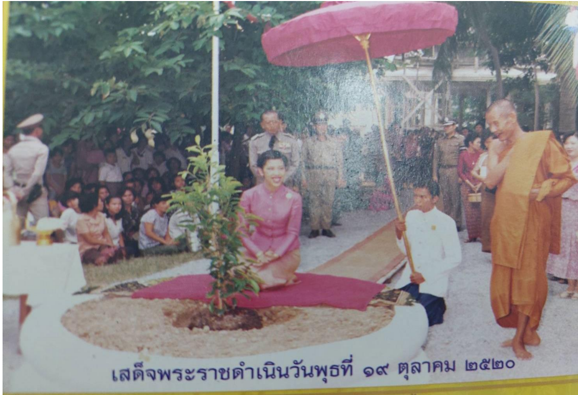
ต้นสาระ ปัจจุบัน