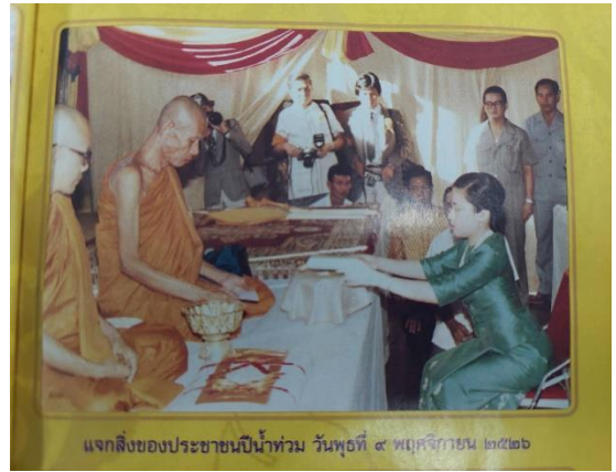
แจกสิ่งของประชาชนป็นน้ำท่วม วันพุธที่ ๙ พฤศจิกายน ๒๕๒๖