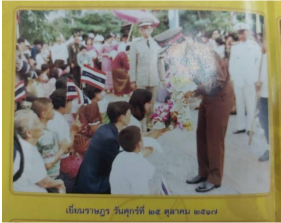
เยี่ยมราษฎร วันศุกร์ที่ ๒๕ ตุลาคม ๒๕๑๗