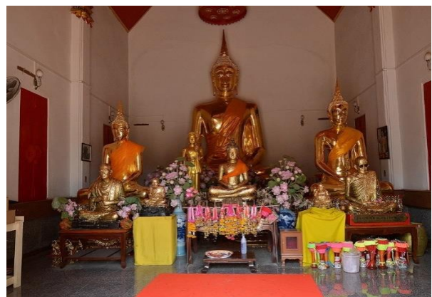
วิหารหลวงพ่อด ณ ปัจจุบัน